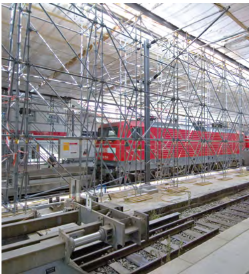
▶ Unzählige Anwendungsbereiche aufgrund des umfangreichen Zubehörprogramms