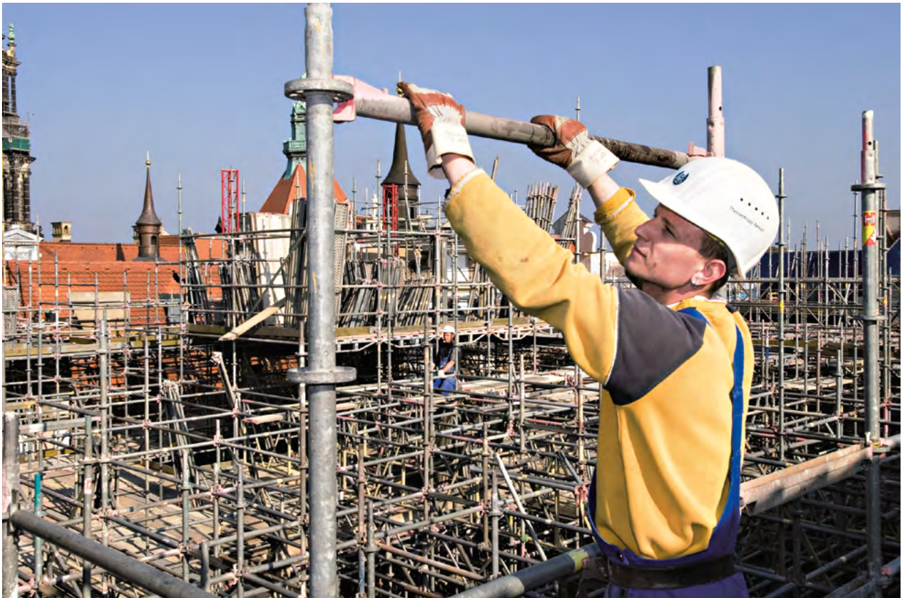
▶ Sichere Ein-Mann-Montage in jeder Höhe dank der aufgekanteten MODEX Teller