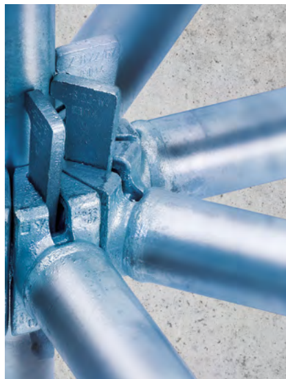
▶ Kraftschlüssige MODEX Verbindungen in acht verschiedenen Richtungen