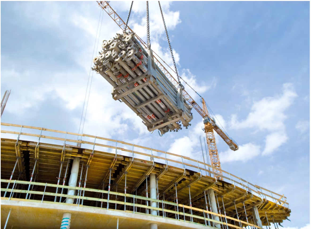
► Sicherer Transport der Stützen im Stapelgestell