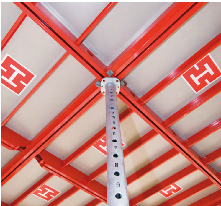
► Schnelle Längeneinstellung der Stütze dank der gelaserten Nummerierung der Abstecklöcher

Hohe Lebensdauer aufgrund der lückenlosen Feuerverzinkung von innen und außen