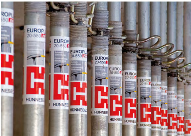
► Hohe Lebensdauer aufgrund der lückenlosen Feuerverzinkung von innen und außen