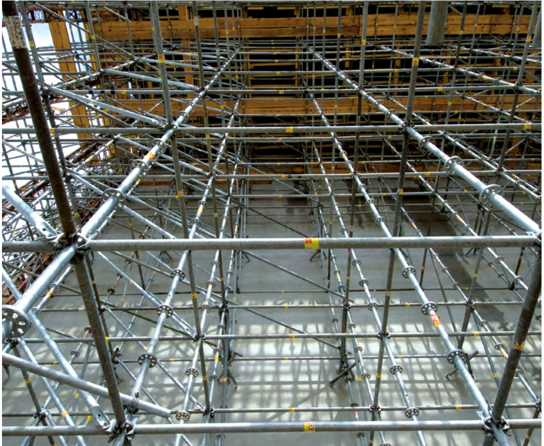
► Einfaches, variables Baukastensystem mit nur vier Grundelementen