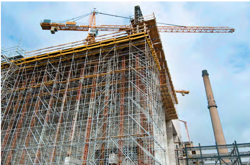
► MODEX eignet sich auch für größere Stützhöhen